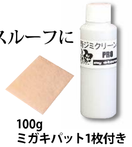
100g ミガキパット1枚付き