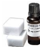
ガラス周りのモールの 劣化復元に ■ETE010樹脂復元剤■